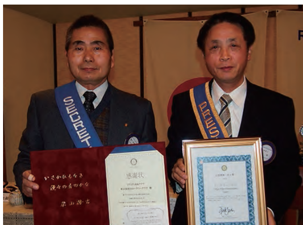
感謝状 (3千万円達成クラブ)・会員増強・拡大賞