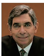
■オスカル・アリアス・サンチェス コスタリカ元大統領 ノーベル平和賞受賞者 ◆ロータリー平和シンポジウム